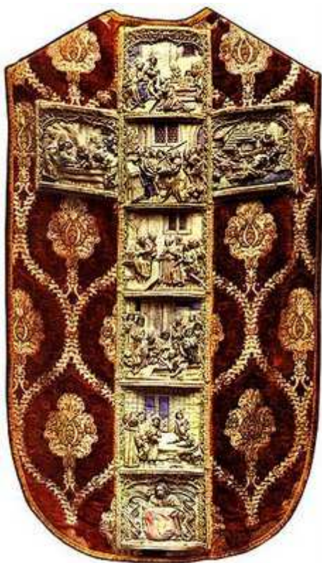
Sławny wawelski ornat (gotycki) ufundowany przez Piotra Kmity, który przedstawia sceny z życia patrona Polski - św. Stanisława

sposób, że tworzyły one jakby kołnierz dokoła szyi kapłana, co było ozdobnym zakończeniem górnego otworu ornaty. Naszycia te zwały się purarami i często ozdobnością niczym nie ustępowały ornamentyce ornatu. Zasadniczo parury wyszywano z tego samego materiału, którego używano przy ornacie. Te ozdoby zanikają po Soborze Trydenckim. Sobór Watykański II przyniósł z sobą przywrócenie dawnych form ornatu ( paenuli i casuli ).