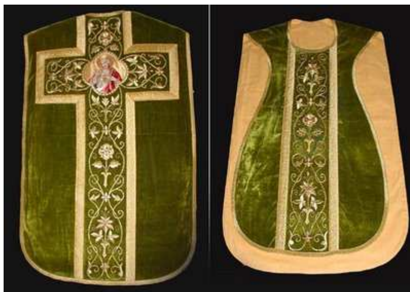
Tzw. ornat rzymski (skrzypcowy), powszechnie stosowany po Soborze Trydenckim

Ornat to wierzchnia szata liturgiczna ubierana przez kapłana podczas sprawowania Najświętszej Ofiary. Jest to rodzaj płaszcza (peleryny) w ciągu wieków przybierającego różne kształty. Noszenie tej szaty liturgicznej jest obowiązkowe dla kapłana podczas sprawowania Mszy świętej w formie nadzwyczajnej, zaś w formie zwyczajnej stosowne dokumenty przewidują od tego nieliczne wyjątki. Zasadniczo ornaty były najbardziej i najpiękniej ozdabiane ze wszystkich szat liturgicznych i to do nich zawsze szyto w komplecie stufy, manipularze, a nawet (w pewnym okresie) alby i humerały upiękkszane tzw. parurami. Odpowiednikiem ornatu na Wschodzie jest felon , którą to szatę stosuje się często również poza sprawowaniem Eucharystii. Natomiast biskup bizantyjski zamiast ornatu ( felonu ) nosi podobny do dalmatyki sakkos .